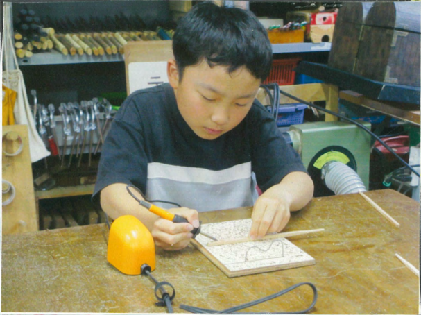
400度の熱で文字を書く

上札内小と中札内小が共に、 帯広児童会館で宿泊学習をした。 18日と19日、まずは最初にグール プで分かれてはしづくりをした。 はしづくりでは、ありがしをみ がいたり、400度の熱で名前 とみよう字を書いたりした。 所は、やすりでみがかくときれ なもようがうきできたことだ。