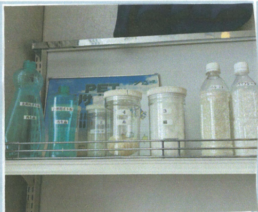
〈ペットや、わたの写真〉

右の写真は、リサイ クルの順番です。ペッ トボトルをこなごなに したPETボトル、 機械でさらにこなごな にしたペット、それ をわたに加エし、そこ から、カーペットやア ルミざらなど、たくさ んのものに、生まれ変 わります。そのほかは 紙、再生紙やシート にリサイクルをまわ おもしろいのです。