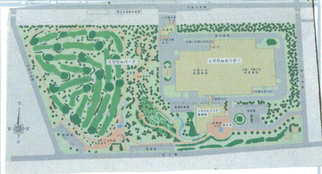
〈くりりんセンター全体マップ〉

九月三日火요일に くりりんセンターに行 きました。 始めにけんしゅうし つでビデオを見ました。 ビデオを見てみると中 に、わたしは、おどろ いたのです。みなさん は、ちえるごみとちえ ないごみは、一緒にす てると思いませんでし