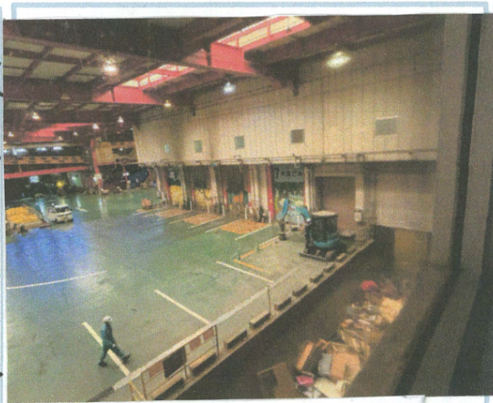
くゴミを運びいれる

次に学んだことは、働いている人のことです。働いている人は、七十五人で一人一人それぞれがう仕事です。わたしは、五十人ほど働いていると思っていきましたが、なんと七十五人働いてそのことがわかってとてもおどろきました。また、一人一人休みがすこしあり、休みが終わるとまた仕事を初