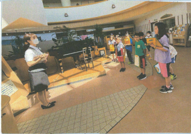
くろびーであちけいほ様子

わたしは、九月三日に、くりりんセンターに行きました。そこでは、たくさん人の機械でゴミをしゃべりしたり、再利用できるようにしています。あたしが一番びっくりしたことは、クレーンの大きいです。予想以上に大きくて、そ