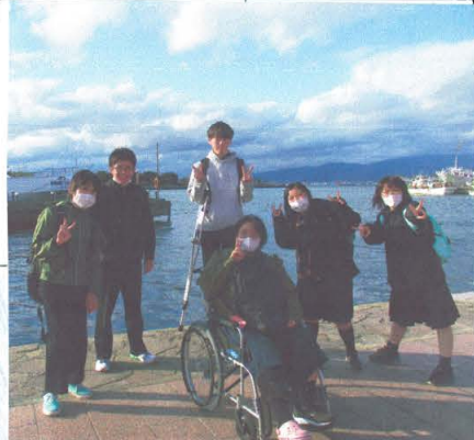
赤レンガ倉庫前での一枚!

五校郭公園では、幸い混んできて大変でした。周金場所の函館山山麓ロープウェイに行く時は迷ったりもしました。