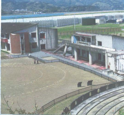
奥山から見た大川小学校

私達は四月二十一日に大川小学校を訪れました。最初の印象は、学校しかないでした。ですが、昔は学校の周りに自軒程あり、津波がくるまで学校は思えなかつたそうです。