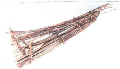
(川で魚をとるためのしかけ)

に行われ てサケ ・アケ ・メ マスなど の魚をと います。こ の魚を マシヤ トセイ の動物ま っの動物 たい