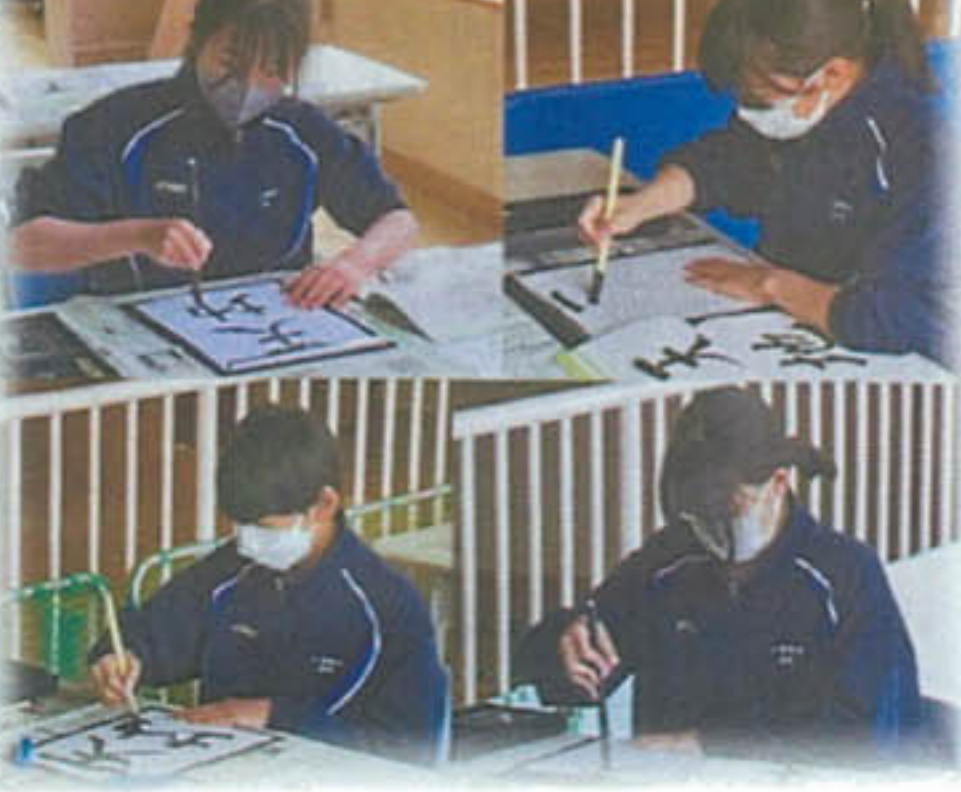
最後の書写の作品〜使期からは行書に〜