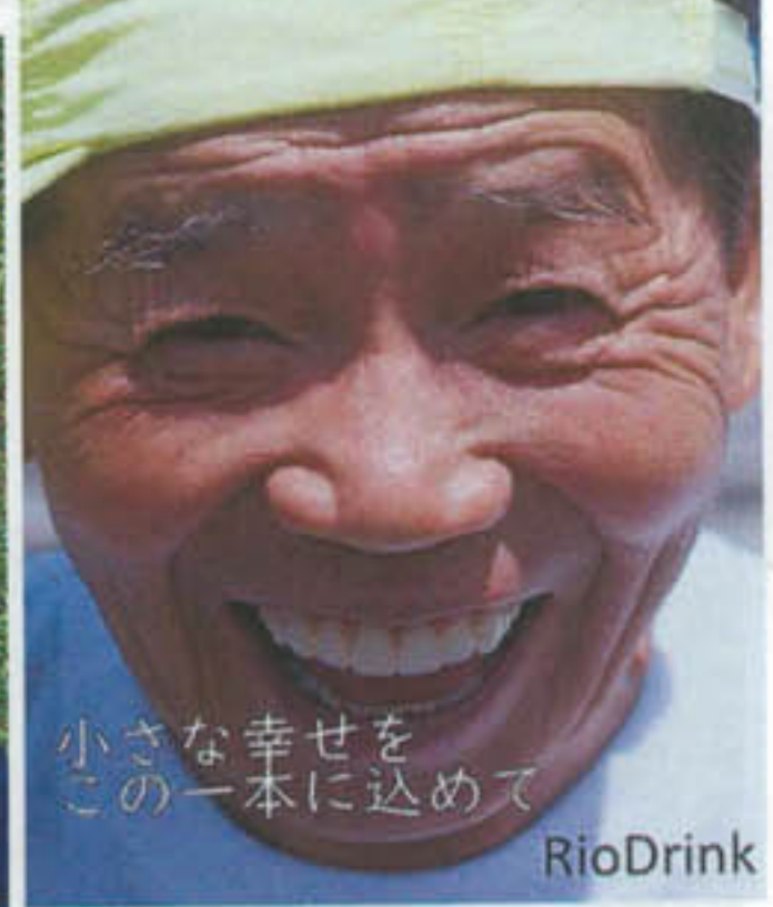
小さな幸せをこの一本に込めて RioDrink