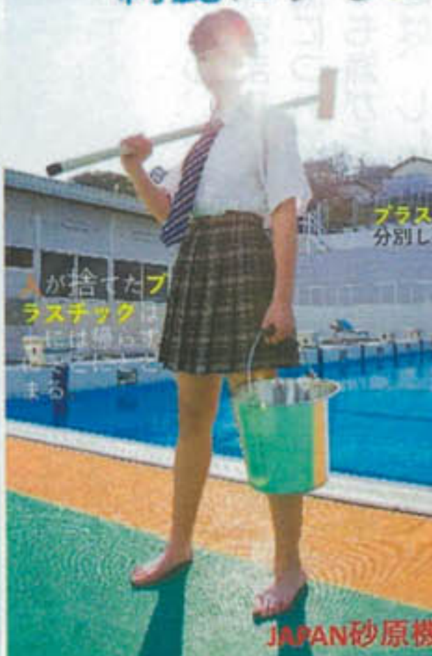
プラスチックは分別しよう。 プラスチックは分別しよう。 プラスチックは分別しよう。 プラスチックは分別しよう。 JAPAN砂原機構