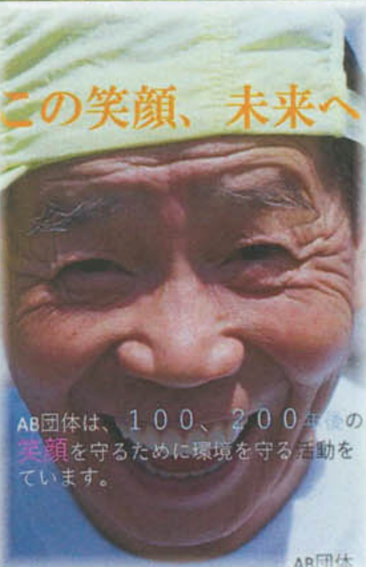
AB団体は、100、200年の 笑顔を守るために環境を守る活動 をしています。 AB団体