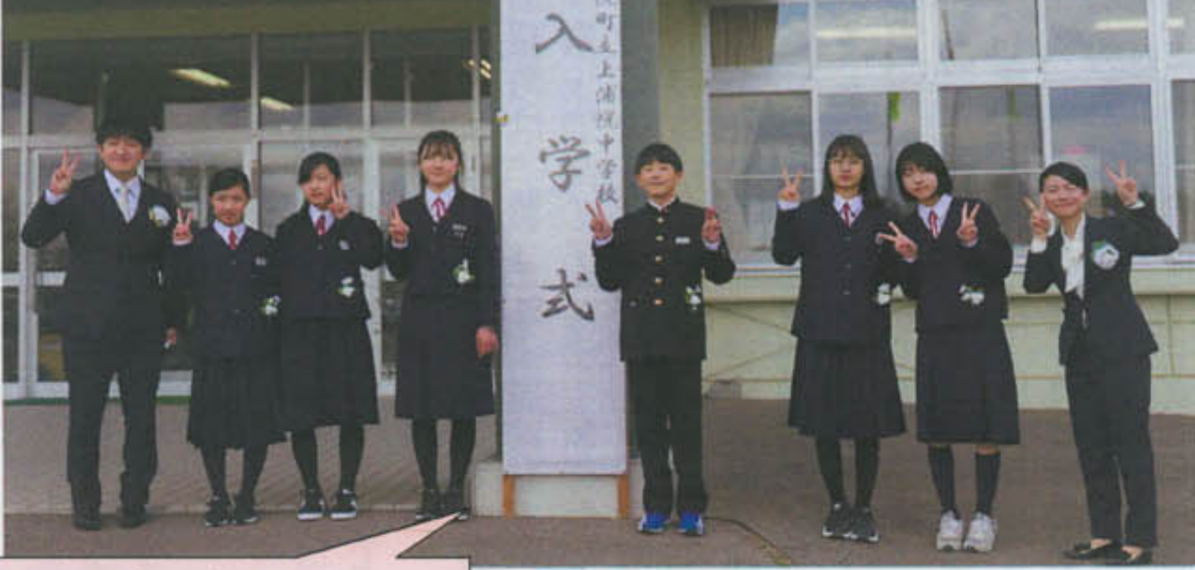
ここから全てがスタートした。一年でたくさん成長したなあ。