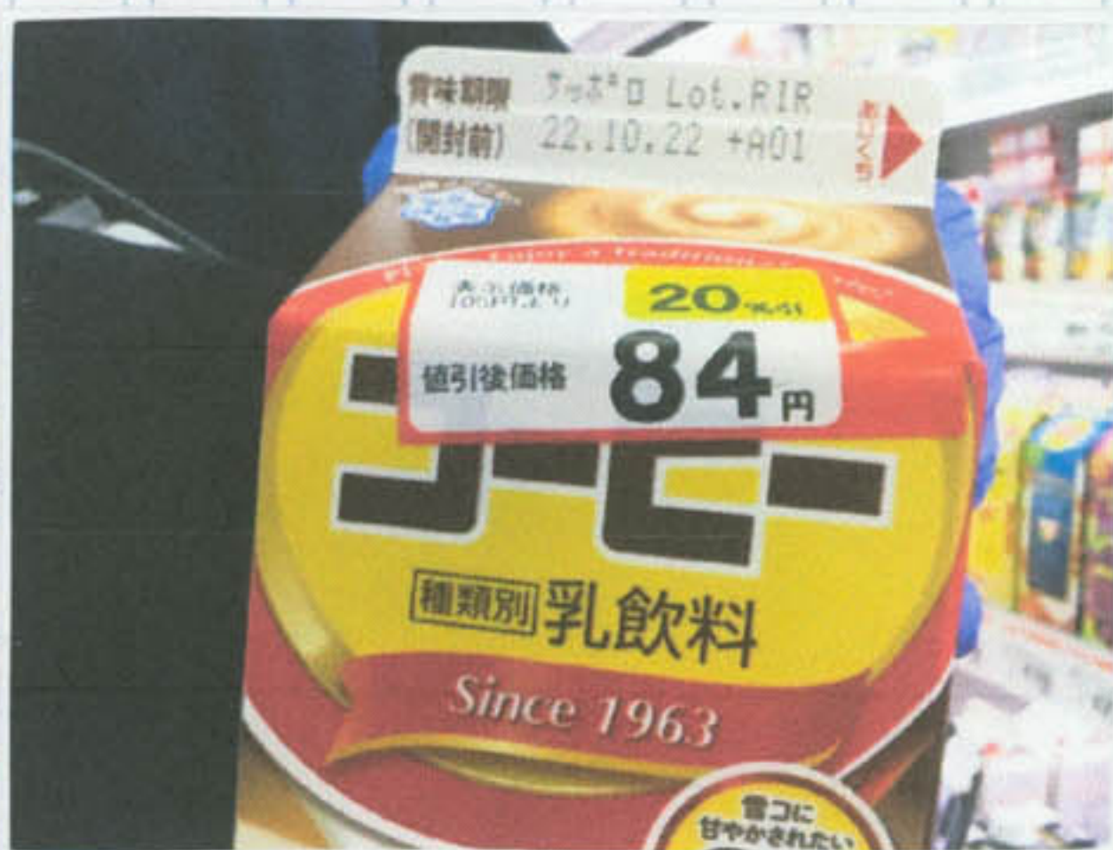
コーヒの値引きシール

わたしは、社会科見学で、フクハラに行きました。わたしが一番おどろいたことは店員さんがコーヒーマックに値引きシールをはっていただけです。わたし